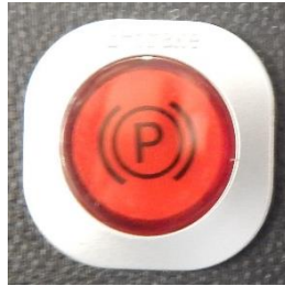
Tryckknappen för aktivering av Ebrake